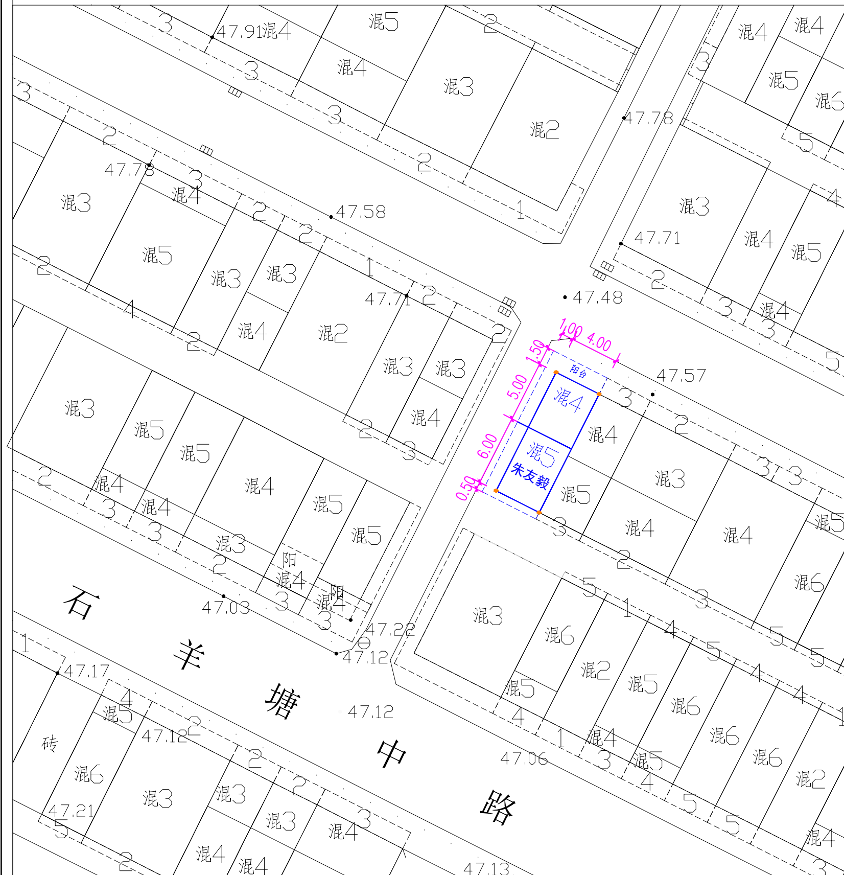
民房规划许可平面图 1:250